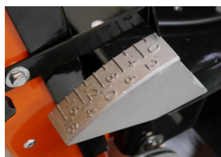
Indicateur de profondeur de coupe