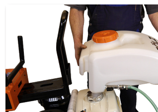
Réservoir d'eau amovible remplissage facile