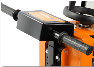
Poignées anti-vibrations réglables en hauteur