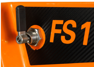
Blocage de la profondeur de coupe