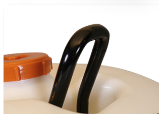
Crochet de levage