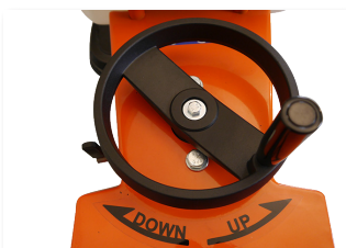
Réglage de la profondeur de coupe par volant